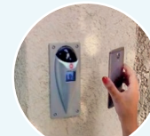
2. La lecture du QR code déclenche une action