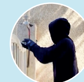
1. Détection d'un intrus

72 % des cambrioleurs passent par la porte d'entrée