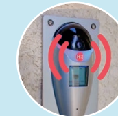
2. Déclenchement de la sirène.